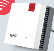
FRITZ!Repeater 1200 AX