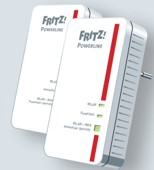
AVM FRITZ!Powerline1240E Set